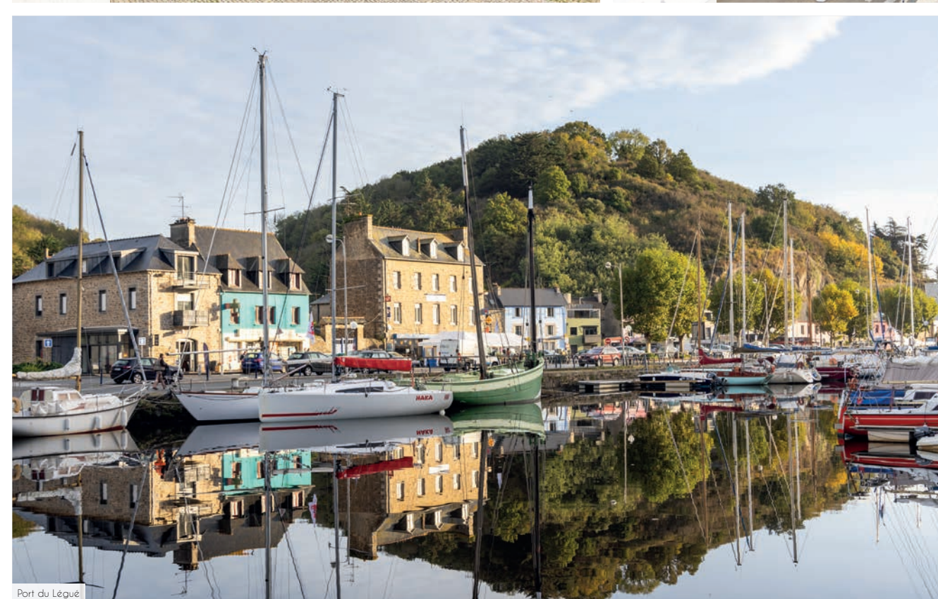
Port du Legué