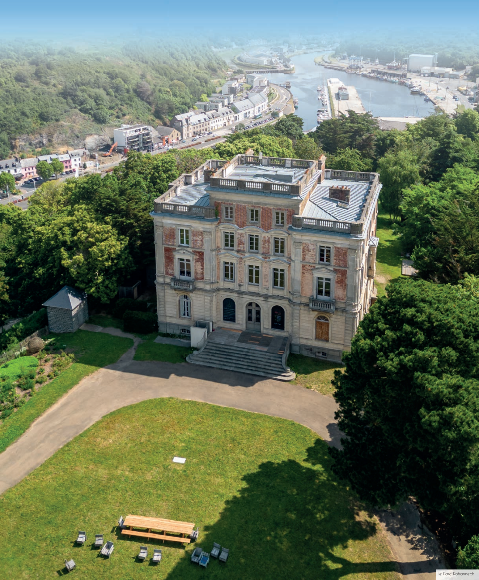
le Parc Rohannech