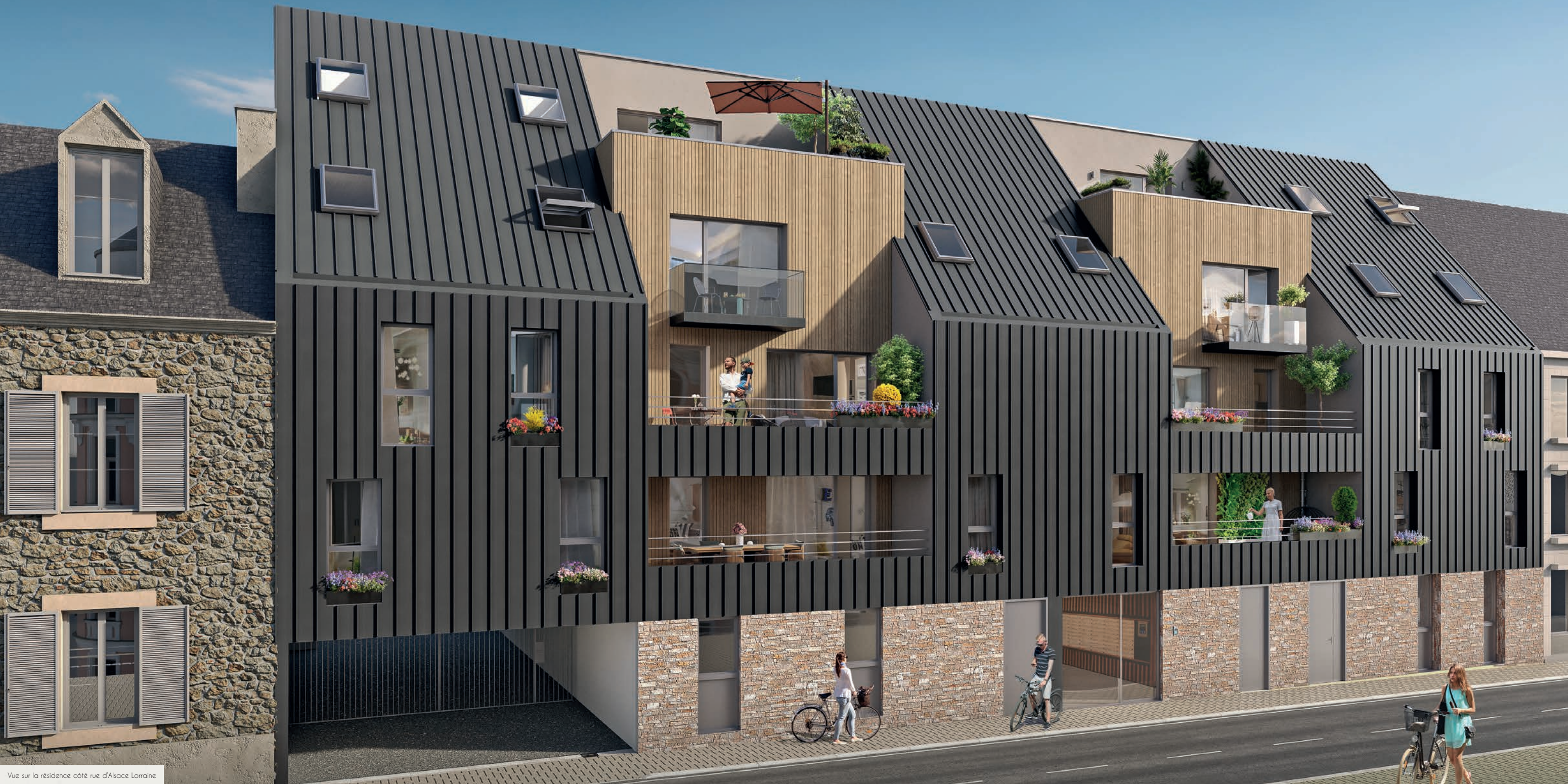
Vue sur la résidence côté rue d'Alsace Lorraine