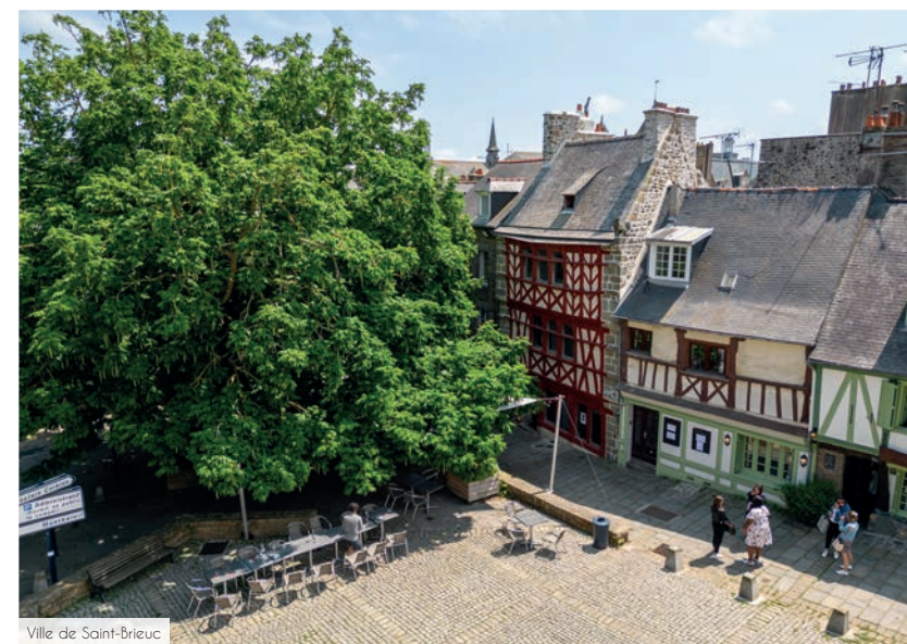
Ville de Saint-Brieuc

Saint-Brieuc s'étend vers la mer, invitant à profiter des reflets de l'océan. Le cœur de la ville bat au rythme d'un centre animé, offrant de nombreuses expériences culturelles, gastronomiques et commerçantes. Son réseau éducatif réunit dans un rayon de 3 kilomètres* les écoles de la maternelle au lycée. Avec des centres médicaux et un hôpital, la ville veille au bien-être et à la tranquillité de ses habitants, plaçant leur confort au premier plan. Saint-Brieuc propose un cadre de vie exceptionnel où l'histoire se marie à la modernité, où la mer rencontre la terre.